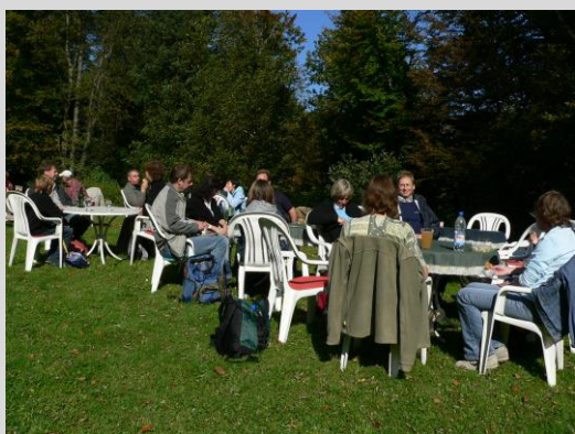
Einkehr im Waldgasthaus „Am Borstein“