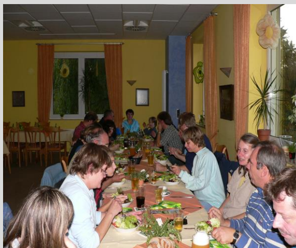
Abendessen in der Kuralpe Kreuzhof