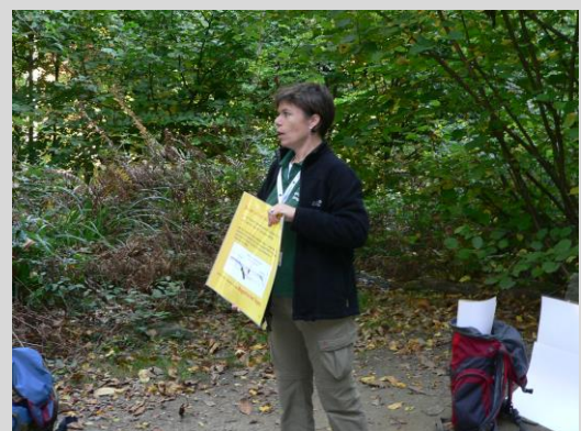
Führung durch den Geopark Felsenmeer